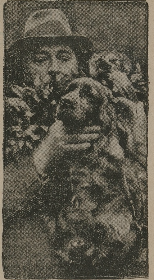
Ten oto psi okaz uznany został za najpiękniejszy egzemplarz psiego rasy na świecie.