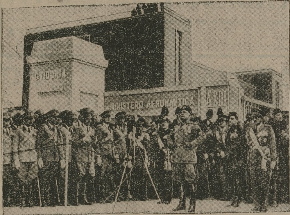
Pod Rzymem odbyło się uroczyste otwarcie nowego miasta Guidonia, zamieszkałego wyłącznie przez lotników. W mieście znajduje się szereg instytucji lotniczych itd. Na zdjęciu — Mussolini przemawia w czasie uroczystości w otoczeniu oficerów korpusu lotniczego.

Z korzyścią dla siebie spełniasz swój obowiązek subskrybując 3% Premijową Pożyczkę Inwestycyjną Pamiętaj 10 maja ubiega termin