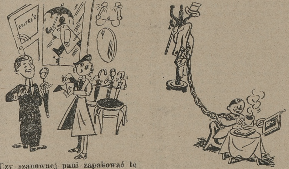
Czy szanownej pani zapakować tę parasoleczkę?

UPRZEJMY SPRZEDAWCA. ABY GARDEROBA NIE ZGINEŁA