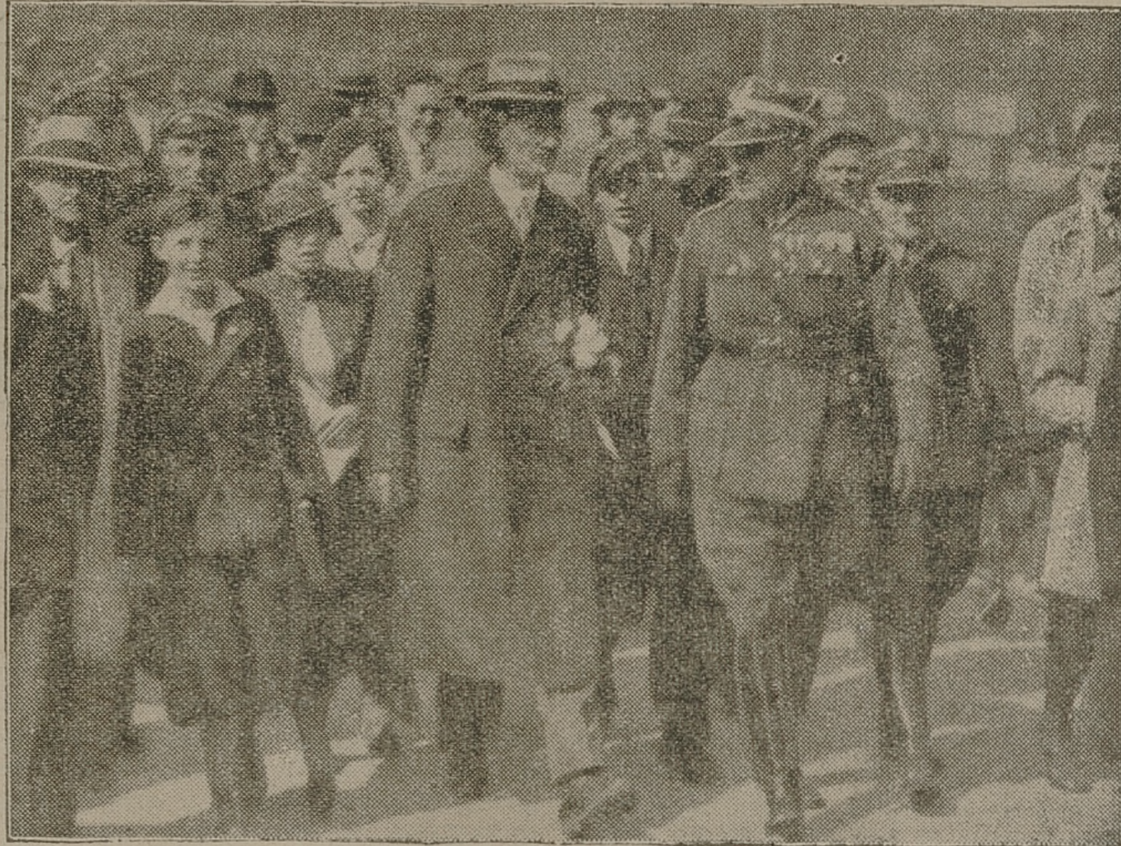
Prof. Piccard w otoczeniu oficerów pułku balonowego po wizycie w zakładach balonowych w Jabłonie.