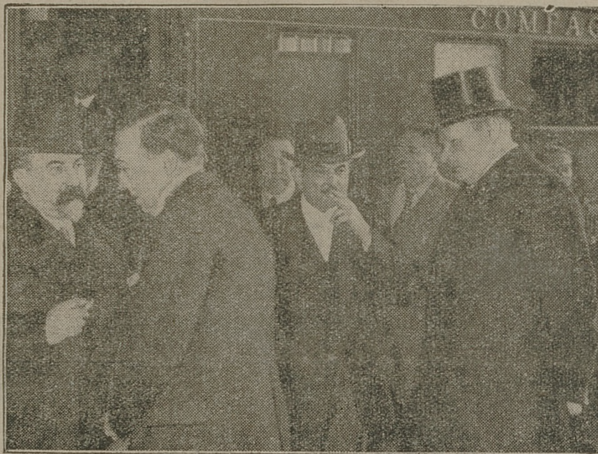
MINISTER LAVAL W PRZEJEZDZIE PRZEZ BERLIN W DRODZE DO WARSZAWY.