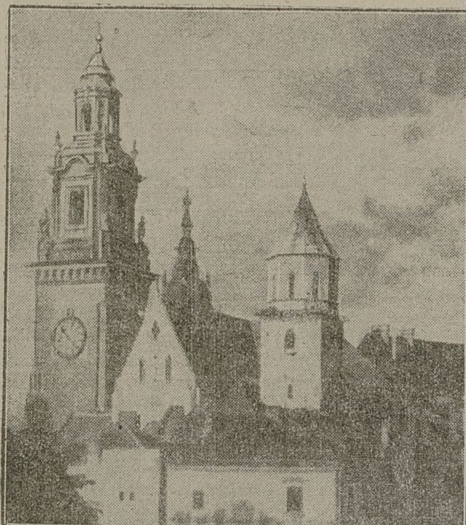
WAWEL — MIEJSCE WIECZNEGO SPOCZYNKU SP. JÓZEFA PIŁSUDSKIEGO.

Zebranie żałobne członków związku młodzieży pracującej „Jedność“ w Sosnowcu odbędzie się jutro o godz. 7.30 wieczorem w lokalu własnym.