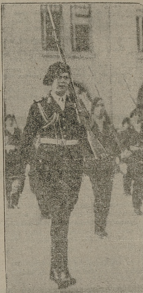
NASTRĘPCA TRONU RUMUŃSKIE- GO NASZERUJE Z ODDZIAŁEM PRZYSPOSOBIENIA WOJSKO- WEGO.

„Najlepiej ukryjesz swe pieniądze w KOMUNALNEJ KASIE OSZ- CZĘDNOŚCI w Zawierciu, której obowiązkiem służbowym jest prze- strzeżenie tajemnicy wkładów“.