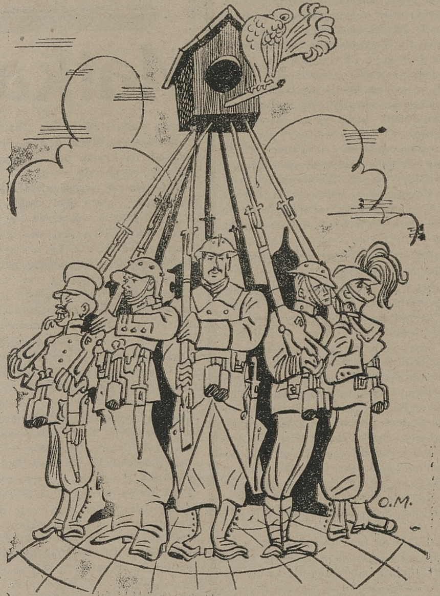
GOŁĘBNIK POKOJU NA PEWNYM FUNDAMENCIE.

× Sejmik bokserów Śląska. W nadejdzącą niedzielę, odbędzie się w sali konferencyjnej „Domu Sportowego“ w Katowicach przy ul. Kilińskiego 23 — roczne walne zebranie Śl. OZB. Jak krąży pogłoski zebranie będzie bardzo burzliwe. Kluby niezadowolone z pracy poszczególnych jednostek w Śl. OZB zamierzają przeprowadzić czystkę.