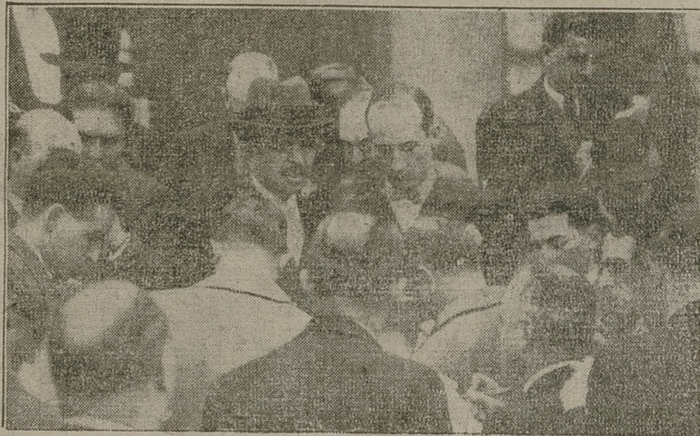
Premier Laval w otoczeniu dziennikarzy.

Pochwały i zastrzeżenia prasy francuskiej