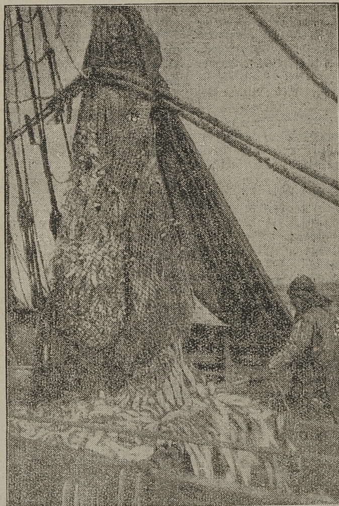
Na połów śledzi ruszyły flotyle rybaki. Na zdjęciu — sieć pełną śledzi wyciągnięta na pokład statku.