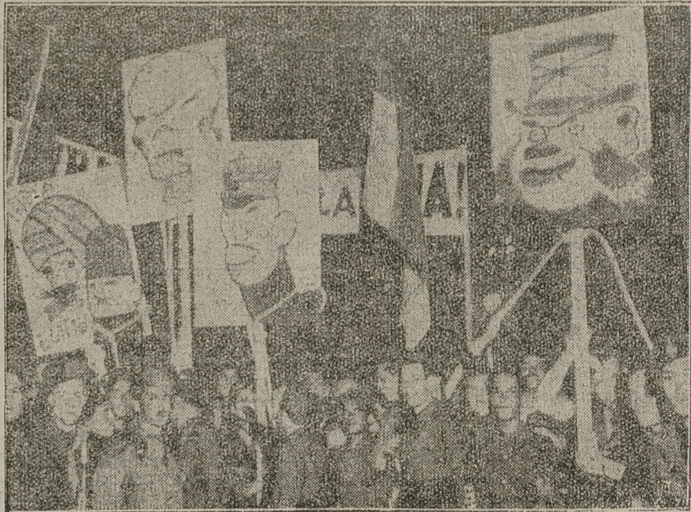
W WIELU MIASTACH WŁOSKICH ODBYŁY SIĘ BURZLIWE DEMONSTRACJE FASZYSTOWSKICH ORGANIZACJI PRZECIWKO ANGLJI I JAPONJI.

Jeszcze w bieżącym tygodniu otwarte ma być w Londynie biuro werbunkowe, dla zaciągania do służby w armji abisyńskiej pielęgniarzek i sanitariuszy.