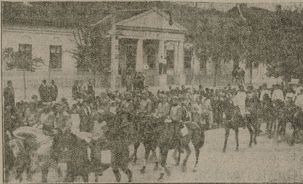
Kolonja niemiecka w Nau Bervas w Jugosławii obchodziła w tych dniach 150-ciolecie istnienia. Na uroczystość tę przybyło wielu Niemców zamieszkających w Jugosławii. Na zdjęciu fragment z tej uroczystości.