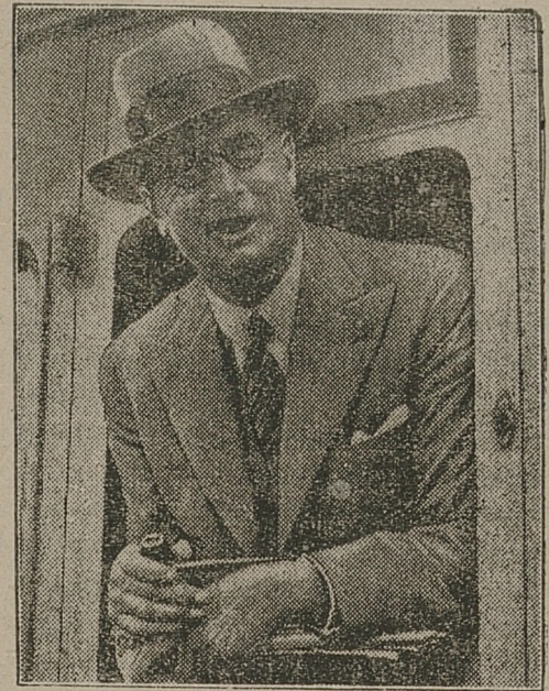
Znany ekonomista angielski sir Fryderyk Leith-Ross udaje się do Chin, jako doradca finansowy.