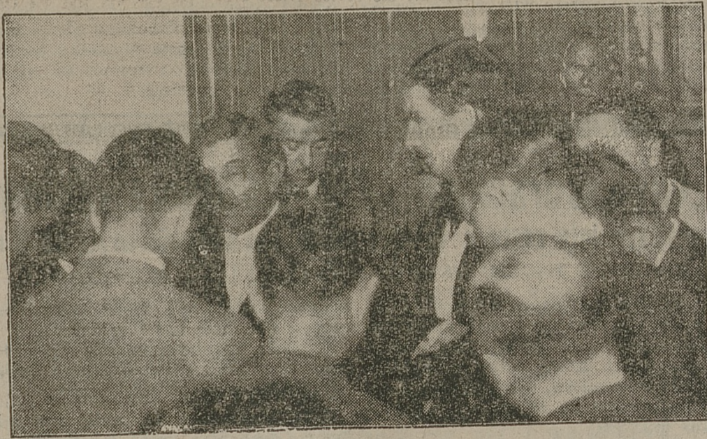
W celu porozumienia się w sprawie konfliktu włosko-abisyńskiego, angielski minister Eden przybył do Paryża. Na zdjęciu premier Laval i minister Eden obłożeni przez dziennikarzy.