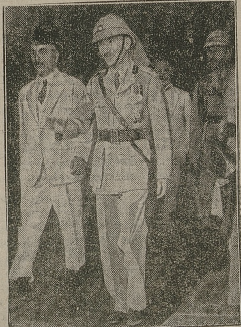
W stolicy Iraku, Bagdadzie, król Ghazi dokonał otwarcia parlamentu. Na lewo w fezie — prezydent ministrów Iraku Jassin Pasza Al Hashimy