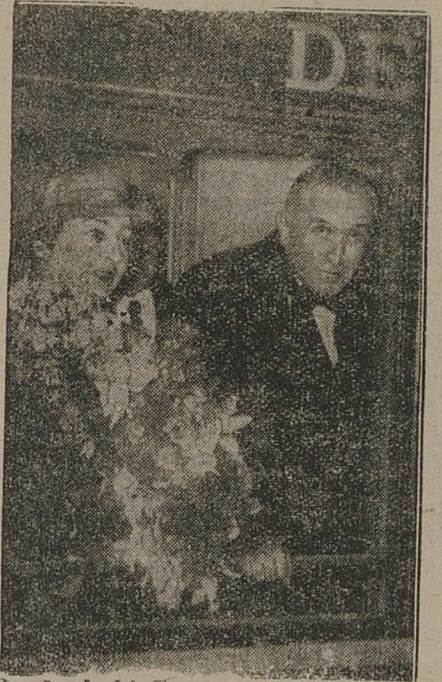
Posel włoski Cerruti przeniesiony został do Paryża.