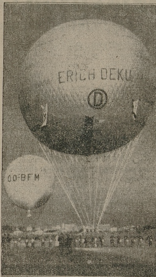
Rozreklamowane niemieckie balony okazały się, jak to już donosiliśmy, niezbyt groźne w konkurencji. Oto start niemieckiego balonu.