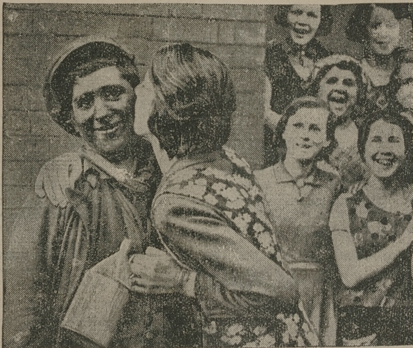
Scena powitania męża - górnika, któremu po 120 godzinach po katastrofie udało się uciec z życiem.