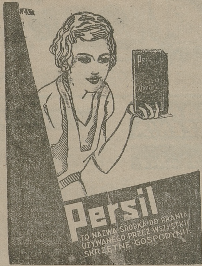
Do moczenia bielizny: HENK O, soda do prania i bielenia.

Zarząd KS. Solvay zawiadamia wszystkie Kluby piłkarskie w Zagłębiu, posiadające drużyny juniorów, iż może rozgrywać zawody koleżeńskie na obcych boiskach, lub też w Grodziecu, na prawach rewanżowych.