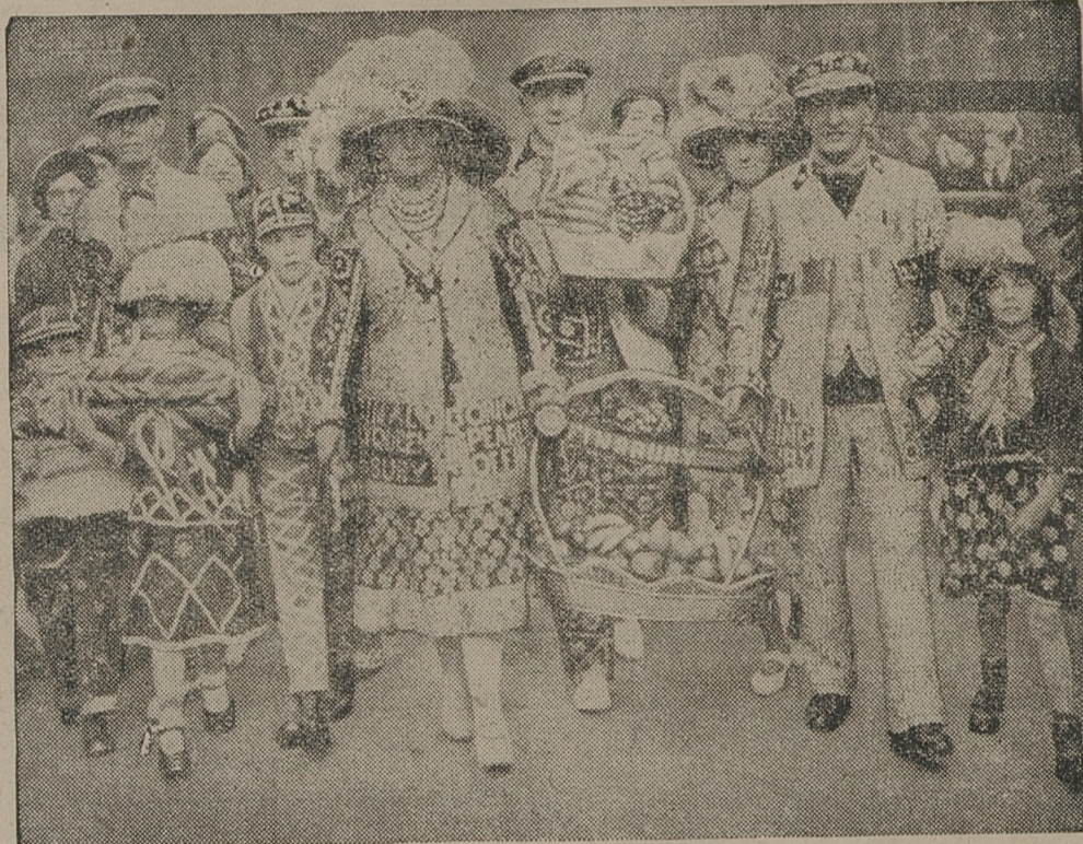
Londyńscy sprzedawcy owoców obchodzą uroczyste święto zbioru owoców. W czasie tego święta sprzedawcy ubrani w oryginalne stroje defilują ulicami miasta.