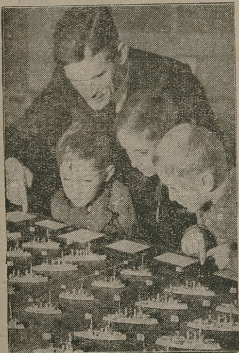
Jeden z marynarzy w Kilonii zbudował w ciągu 3-ech lat 2350 miniaturowych okręciaków wojennych z pudełek od cygar. Flota ta jest obiektem zachwyty młodzieży

KRÓLEWIEC, 2. 11. Statek handlowy „Ingsterburg“ z Królewca, o którym od 10-ciu dni brak było jakiegokolwiek wiadomości, zatonał wraz z 15-tu osobami na wybrzeżu holenderskim. Ostatniej nocy morze wyrzuciło w Egmond zwłoki pierwszego oficera Borgholza .