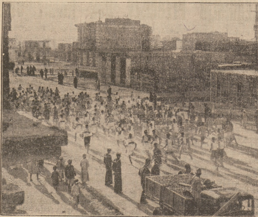
Marynarze stacjonowanych w Aleksandrii wojennych okrętów angielskich urządzili sobie bieg maratoński. Na zdjęciu moment startu.

(z) Włamanie do spółdzielni w Niegowicach. W porze nocnej nieznani sprawcy dokonali włamania do spółdzielni „Jedność” w Niegowicach, gminy Rakitno-Szlaheckie. Sprawcy, którzy dostali się do wnętrza spółdzielni za pomocą wylomu biurze skradli większą ilość towarów, których wartość zarząd spółdzielni oblicza na sumę 1200 złotych. Zawiadomiona o kradzieży policja wszczęła natychmiastowe energiczne dochodzenie.