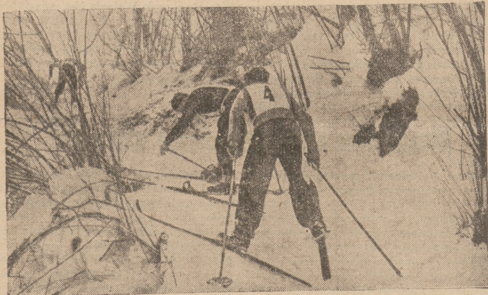
Narciarze również przyjeżdżają do Garmisch - Partenkirchen i tam trenują do batalii narodów. Na zdjęciu narciarz ze finsej podczas treningu.

wejść miałyby: Ruch, Śląsk, Dąb, dalej pierwsze kluby z tabeli ligi śląskiej oraz Brygada z Częstochowy. W skład ligi warszawsko-lódzko-pomorskiej: Legia, Warszawianka i Polonia (Warszawa), ŁKS i Union Touring (Łódź), Warta i Lechia (Poznań) oraz Polonia (Bydgoszcz). Wreszcie w skład ligi wschodniej miałyby wejść następujące kluby: Śmigły (Wilno), Unia (Lublin), Warmja (Grajewo), Strzelec (Siedlce), P. K. S. (Łęka), Hasmonae (Równe), oraz W. K. S. (Grodno).