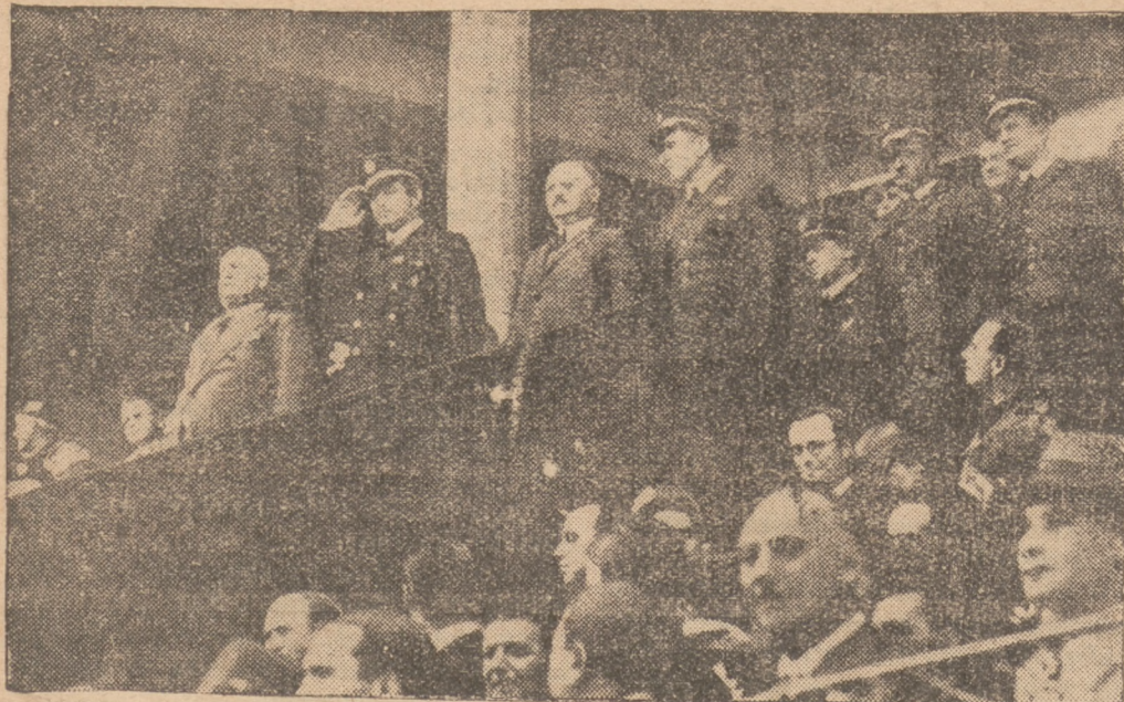
Synowie Mussoliniego Bruno i Vittorio powrócili już z Abisynji do ojczyzny. Widzimy ich stojących po prawej stronie na trybunie, z której ojciec ich i księżę Starehemberg przyglądają się meczowi piłki nożnej pomiędzy reprezentacjami Austrii i Włoch.