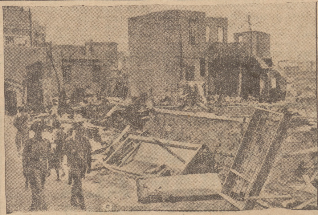
Patrol angielski krąży po ulicach miasta palestyńskiego Tel - Aviv, w której - jak to widzimy na zdjęciu - arabowie dokonali wielkich spustoszeń w ostatnim ruchu antyżydowskim.

Na szosie pomiędzy Jerozolimą a Haifa wszystkie pojazdy konwenjowane są przez żołnierzy, którzy na samochodach ciężarowych jadą na przedmie i z tyłu wehikulów.