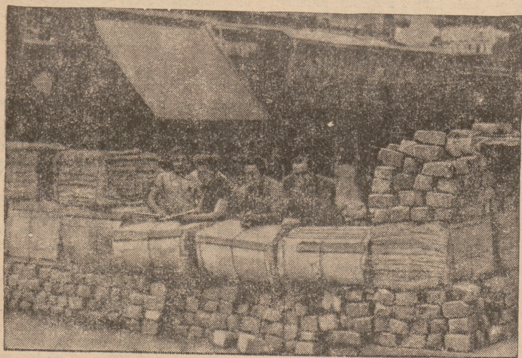
Barykady ezerwonych na jednym z przedmieść Madrytu.