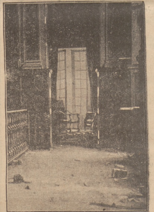
Ostatnio dokonano w Lizbonie (stolica Portugalii) szereg zamachów bombowych. Na zdjęciu zdemolowane drzwi w konsulacie hiszpańskiego rządu gen. Franco.

Dawniej rozpoczynały się wojny, w przedpokojach gabinetów panujących, dzisiaj zaś w laboratoriach. Są one niejako główną próbą tego, co przepracowali uczeni poprzednio w swoich pracowniach. Do takich ostatnich wynalazków należy kula Gerlika „Ultra“, która przebija nawet panczerze ze stali czy niklu, grubości dwa i pół cm. Przez panczer lekkich tanków przechodzi ta kula jak przez masło. Drugim wynalazkiem jest półautomatyczny karabin, mogący być obsługiwany przez zupełnego laika. Wyrzuca on 60 kul na minutę, waży 8 kg. W promieniu 500 metrów trafia każdy przedmiot bezapelacyjnie. Używano do tej pory gangsterzy amerykańscy, nie mniej jednak zainteresowały się nim sfery wojskowe.