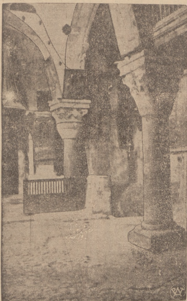
Świątynia Grobu Chrystusowego w Jerozolimie — Fragment wnętrza.