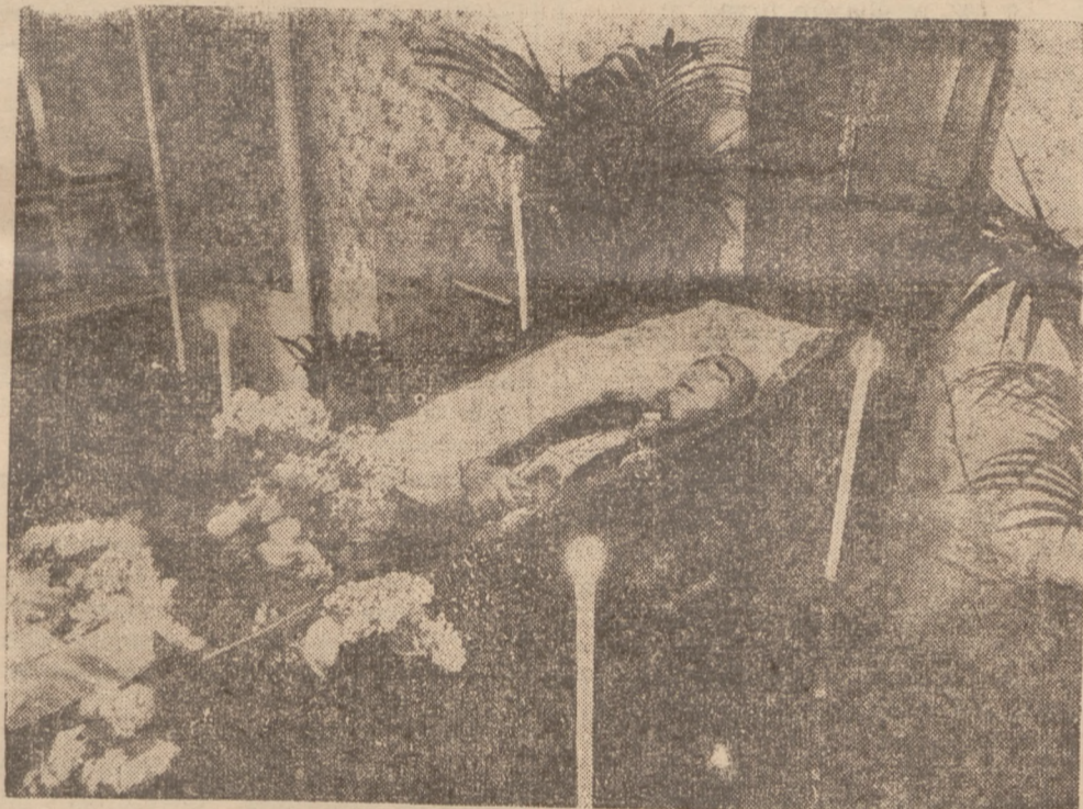
PO ZGONIE KAROLA SZYMANOWSKIEGO.

SKŁADAJĄCIE OFIARY NA NAJELNY KOMITET UCZCZENIA PAMIĘCI MARZAŁKA JÓZEFA PIŁSUDSKIEGO KONTO P. K. O. 13-13