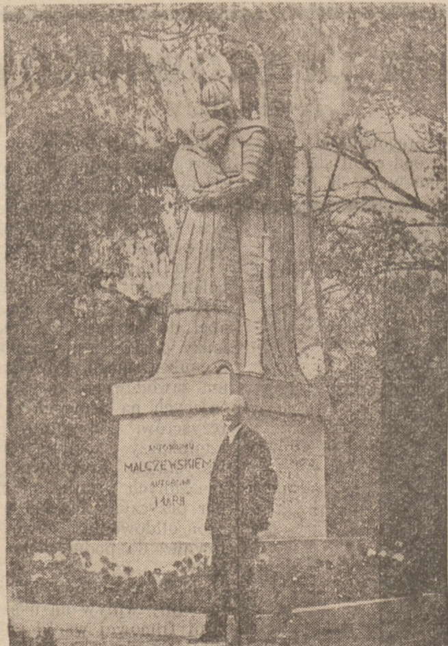
POMNIK BOHATERKI POEMATU MALCZEWSKIEGO W POZNANIU.

Wzruszony tymi dowodami życzliwości poskramiacz odwołał strajk i oświadczył, że na żądanie publiczności będzie kontynuował swe występy cyrkowe.