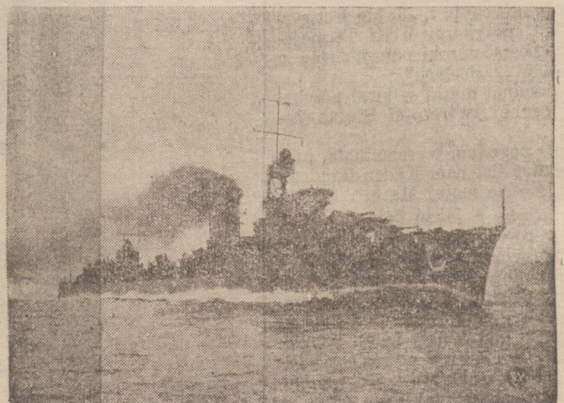
PRÓBA SPRAWNOŚCI „GROMU”.

DZIECKO POLSKIE — W POLSKIEJ SZKOLE POPRAZĄ ZBIÓRKĘ NA SZKOŁY POLSKIE ZA GRANICĄ