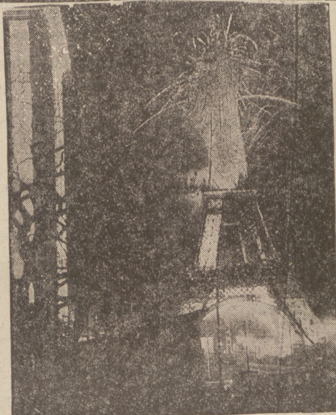
U WRÓT WYSTAWY SZTUKI I TECHNIKI W PARYŻU.

Reklamuj się tylko w „Expresie Zagłębia” najpoczytniejszym piśmie województwa kieleckiego