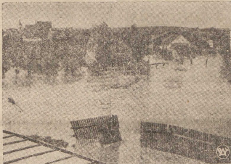
Zdjęcie nasze przedstawia zalane wodą tereny w Skalbierzcu, pow. Pińczów. Okolice te, obok Miechowa i