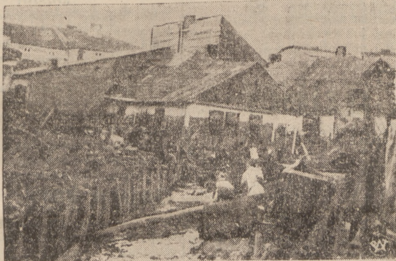
Reprodukujemy zdjęcie, wykonane na terenach nawiedzonych katastrofalną powodzią na obszarze woj. kieleckiego i krakowskiego.