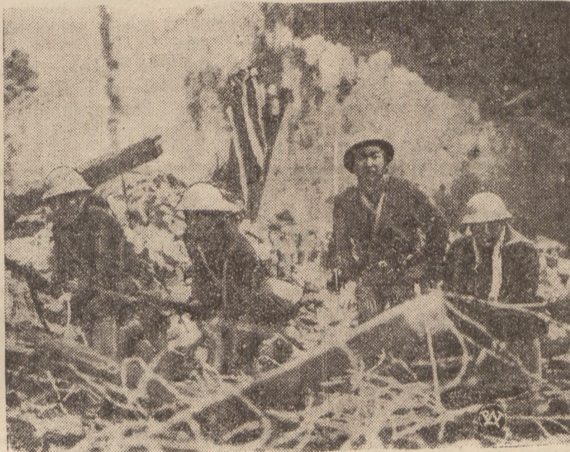
Z WOJNY CHIŃSKO-JAPOŃSKIEJ