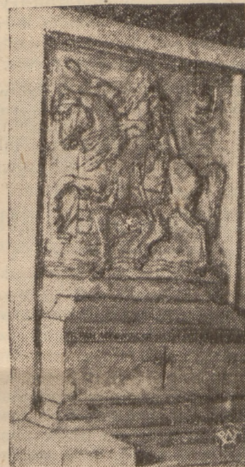
Sarkofag — pomnik Stefana Czarneckiego, do którego zostanie przeniesiona trumna ze szczątkami hetmana.

Była Polska 17-go wieku wielką i zwycięską, była Polską wielkich wodzów i statystów — ale była zarazem wewnętrznie rozbita, młota-