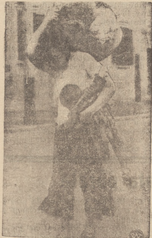
Na zdjęciu drugim widzimy nie zwykle wymowną scenę z ewakuacji bombardowanych przez Japończyków miast chińskich, a mianowicie kobietę chińską z dzieckiem i z całym swym dobytkiem, ratującą się ucieczką z Szanghaju.

Poczem klękał przed wiszącym na ścianie obrazem, a zanim wszyscy zebrani. Każdy bowiem z chłopów nie śmiał na wezwanie księdza nie klęknąć przy modlitwie. Po zmówieniu pacierza, ksiądz Stojanowski wstawał i triumfalnie oznajmiał: — „A zatem wniosek przeszedł, możecie się rozejść do domów”.