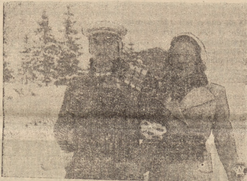
JAN KIEPURA I MARTA EGGERTH.

Dotychczasowa działalność i wytyczne wskazują, że świetlica strzelecka spełnia zaszczytną rolę — oświecenia i wyrobienia społecznego w duchu narodowym i religijnym wśród ludności odległych wiosek powiatu bębrowskiego.