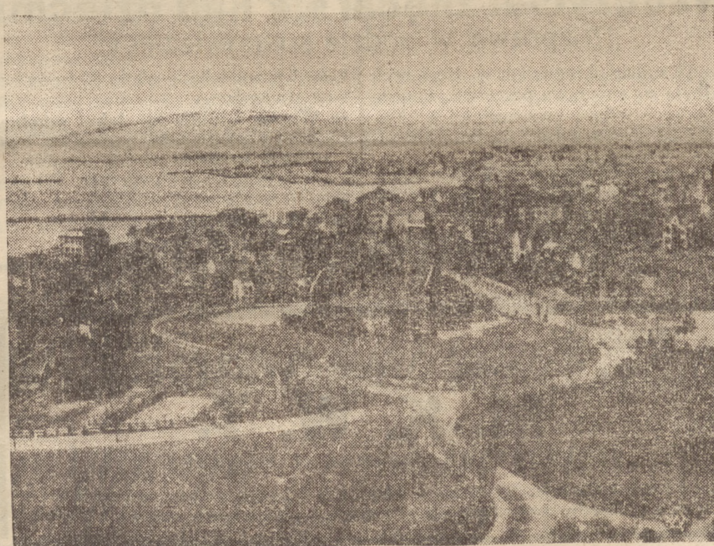
POZOGA WOJENNA W CHINACH

Korespondenci Ag. „Echa” donoszą: Ostatnimi czasy daje się zauważyć odplyw oddziałów prowincjonalnych należących do ZZZ do Klasowych Związków Zawodowych. W grudniu przeszli robotnicy z huty szklanej w Grodnie oraz z huty szklanej w Wilnie i Opocznie do PPS.