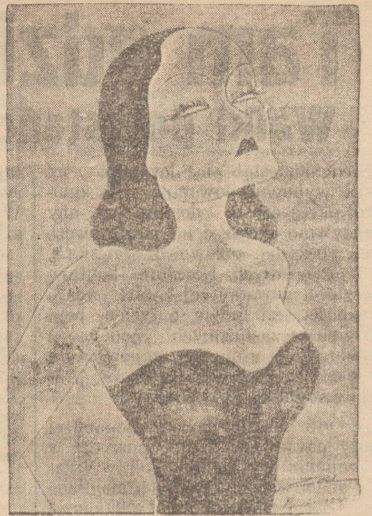
MARLENA DIETRICH w karykaturze.