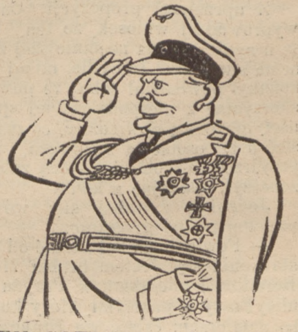
GEN. GOERING w karykaturze. puszczałnie dwa do trzech dni, a stam- tąd powrócić ma bezpośrednio do Berlina

Sytuacja czerwonych, walczących w Teruelu z dnia na dzień staje się co- raz niekorzystniejsza, gdyż grozi im całkowite odcięcie odwrotu.