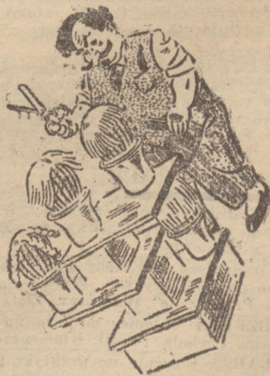
Fryzjer jako hodowca kaktusów.