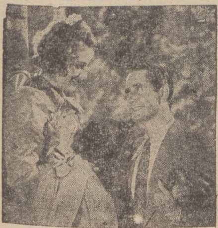
Joan Fontaine i Nino Martini w filmie „Music for Madame”.