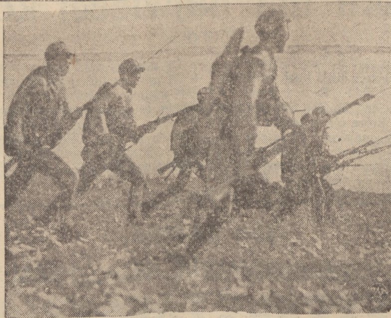
NA POBOJOWISKACH DALEKIE GO WSCHODU.

Reprodukcujemy zdjęcie o wysokim napięciu dramatycznym, przedstawiające oddział Chińczyków, ruszających z wyciągniętymi bagnietami do ataku na pozycje japońskie.