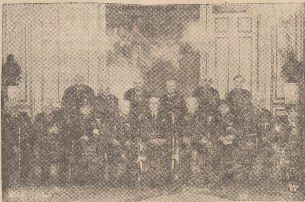
WETERANI Z 1863 ROKU NA ZAMKU KRÓLEWSKIM.

Nie pójdę więc drogą prawą, lewą ani centrową, jak to niektórzy przewidują. Pójdę drogą, którą mi drogowskaz Wodza Naczelnego wskazuje, prowadzącą ku dobru Narodu i Państwa”.