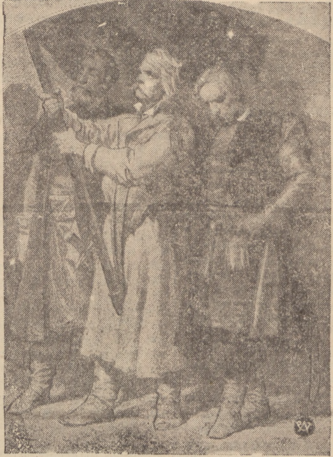
„POWSTAŃCIEC Z LUDU ZE SZTANDAREM” Z cyklu „Polonia” — Artura Grottgera.