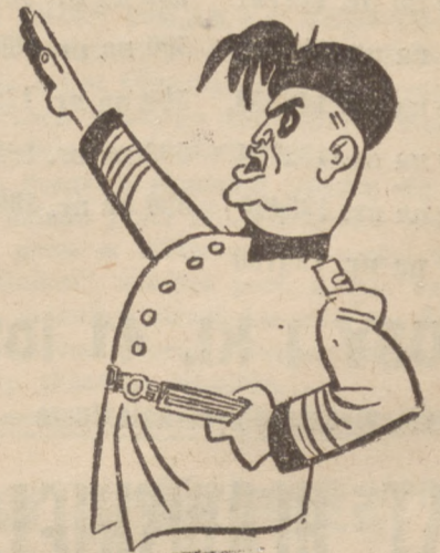
Mussolini w karykaturze.

Niemcy do tej akcji przyłożą w ten sposób rękę, że wysłać mają do Rzymu większą ilość samolotów „komunikacyjnych”. Wszyscy piloci otrzymają paszporty prywatnych lotników. Amunicja zostanie wysłana z portów północnych i bałtyckich, aparaty zaś przeleżą najpierw do Włoch, a stamtąd przez Francję do Hiszpanii.