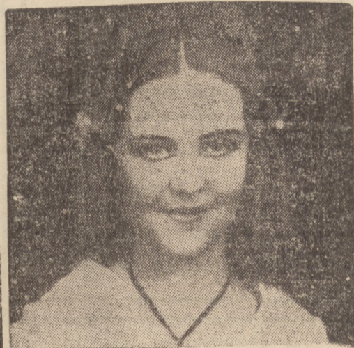
ZARĘCZYNY NA DWORZE ALBANSKIM.

Jeżeli zatem ktoś zawarł tego rodzaju umowę z pracodawcą, nie może z tytułu jej niedotrzymania robić jakichś pretensyj, poza przewidzianymi w ustawie ubezpieczeniowej uprawnieniami do zasiłków i odszkodowań.