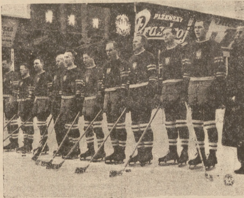
MIĘDZYNARODOWE MISTRZOSTWA HOKEJWE.