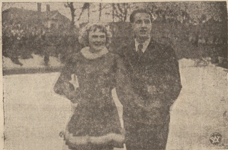
MISTRZOWSKA PARA ŁYŻWIARSKA.

W swoim czasie, gdy Harris został aresztowany przez policję i gdy przyznał się do winy, mąż napadniętej przez niego kobiety wraz z kilkunastu przyjaciółmi i sympatyzującymi, domagał się od policji, by wydano więźnia w celu zlindegowania go. Z wielkim trudem policji udało się podówczas uratować życie aresztowanego murzyna.