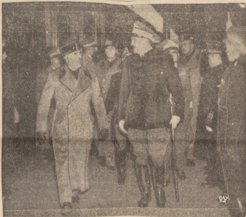
TRIUMFALNY POWRÓT MARSZAŁKA GRAZIANIEGO DO RZYMU

Do Rzymu wrócił b. wicekról Abisynii i zwycięski wódz wojsk włoskich w Abisynii marsz. Graziani, witany owacyjnie przez całą ludność włoską. Na zdjęciu — marsz. Graziani opuszcza dworzec rzymski w towarzystwie Mussoliniego.