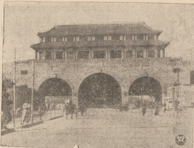
NA FRONCIE WALK CHINSKO-JAPOŃSKICH

Reproduujemy jedną z historycznych bram Nankinu, nad którą powiewa dzisiaj sztandar japoński. Jak do noszą depeche z Chin, wojska japońskie opanowują coraz to nowe obszary tego kraju.