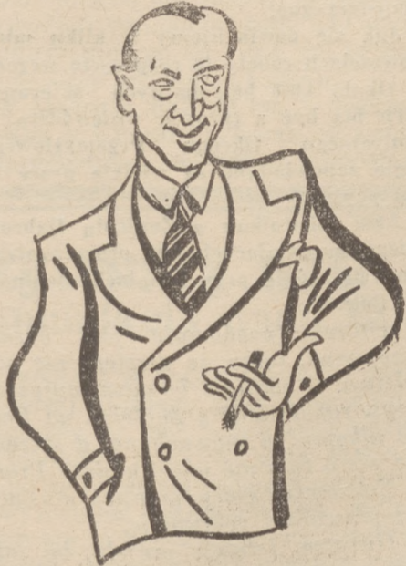
Min. Beck w karykaturze.

Sposób przyjęcia min. Becka w Rzymie przeszedł wszelkie oczekiwania. Już powitanie przekroczyło swymi rozmiarami i świetnością ramy zwyczajów protokolarnych. Później zaś polski minister spraw zagranicznych był podejmowany z tak niezwykłą serdecznością przez II Duce, min. Ciano i władze włoskie oraz witany owacyjnie przez ludność stolicy Włoch gdziekolwiek się pokazał, że już sama zewnętrzna strona wizyty stała się gorącą manifestacją przyjaźni polsko-włoskiej, nie pozbawioną dużego znaczenia dla dalszych stosunków między oboma narodami.