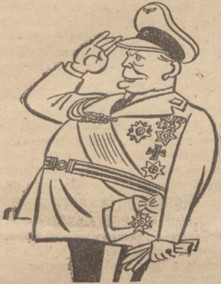
Gen. Goering w karykaturze

Podjęte zostaną odpowiednie zarządzenia w celu przelania interesów żydowskich w ręce Aryjczyków. W ciągu 4-ech lat Żydzi mają zniknąć z Austrii.