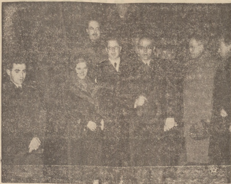
Na zdjęciu — min. Skirpa w towarzystwie rady MSZ. Kościelkowskiego i sekretarza Poselstwa Litewskiego w Warszawie, po przybyciu na dworzec Główny.

powitania posła litewskiego plk. Skirpy w Warszawie i posła polskiego min. Charwata na granicy polsko-litewskiej.