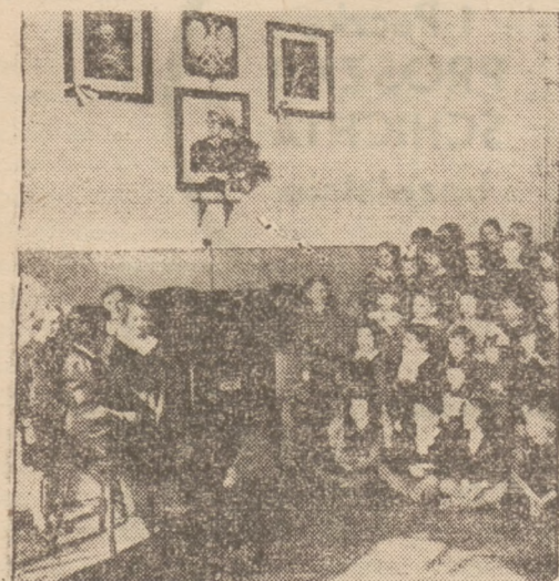
Fotografia przedstawia grupę dzieci szkolnych przy odbiorniku radiowym podczas audycji.

Staraniem i z funduszy koła rodzicielskiego Szkoły Powszechnej nr. 3 im. Emili Palter w Katowicach zainstalowano w 17 salach szkolnych i rekreacyjnych głośniki za pośrednictwem których nadawane są audycje radiowe oraz muzyka z płyt — zwłaszcza przy ćwiczeniach cielesnych. „Stacją nadawczą” szkoły jest odbiornik radiowy ustawiony w pokoju nauczycielskim, a połączony z adapterem i mikrofonem, przy pomocy którego kierownictwo szkoły podaje jednocześnie wszystkim 805 uczniom komunikaty i zarządzenia porządkowe. Mikrofon służy również do wygłaszania odczytów, pogadek itp.