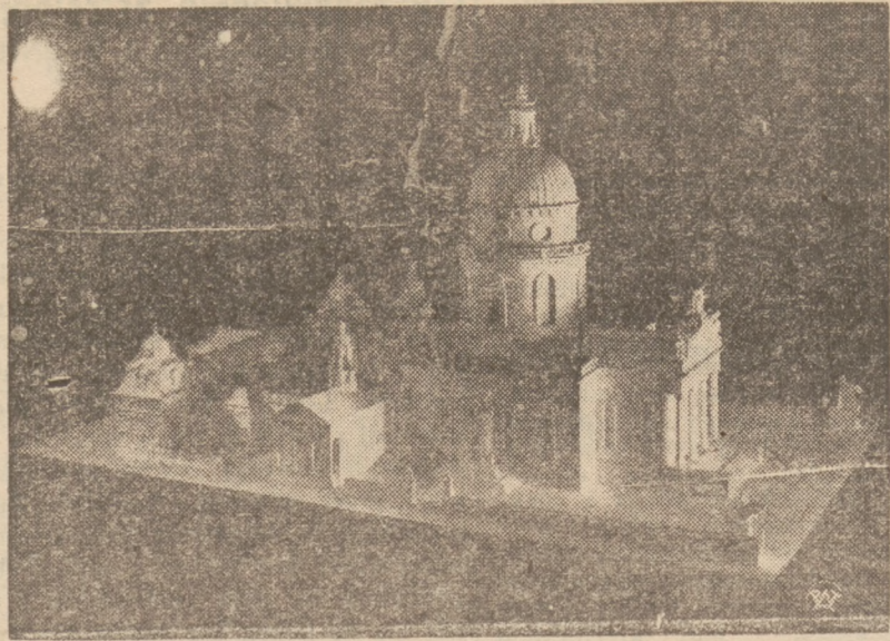
• Katedra Śląska