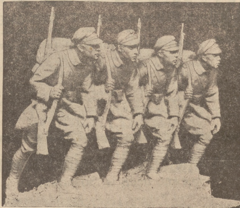
POMNIK LEGIONÓW POLSKICH W KIELCACH

Już wkrótce zakończone zostaną prace, zmierzające do utworzenia w zamku kieleckim Sanktuarium Marszałka Józefa Piłsudskiego i Muzeum Legionów, budowy Pomnika Legionów, oraz wzniesienia obelisków, kapliczek itp. namiątek w miejscach, wslawio-