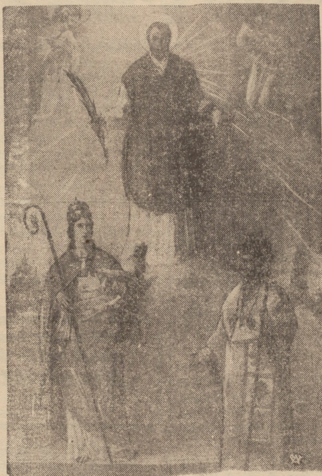
PO ZALICZENIU BŁOGOSŁAWIEGO ANDRZEJA BOBOLI DO GRONA ŚWIĘTYCH