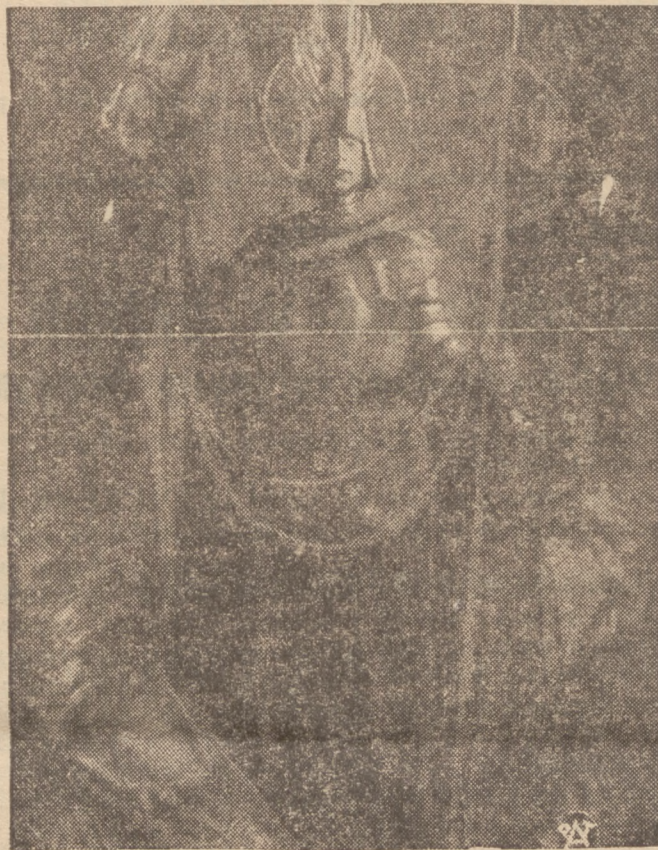
DAR ARTYSTY DLA KOŚCIOŁA GARNIZONOWEGO W BYDGOSZCZY

Powodowało to wskutek rozluźnienia łuski huk, jak również charakterystyczny łot pocisku. Kule takie są bardzo niebezpieczne, powodują bowiem straszliwe rany.