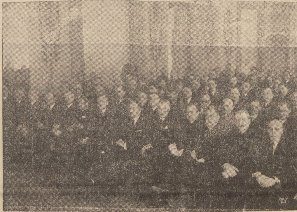
RADA NACZELNA OBOZU ZJEDNOCZENIA NARODOWEGO

Na zdjęciu — rzut oka na plenar- ne obrady Rady Naczelnej Obozu Zjednoczenia Narodowego, która od- była swe konstytucyjne zebranie pod przewodnictwem szefa O. Z. N. gen.