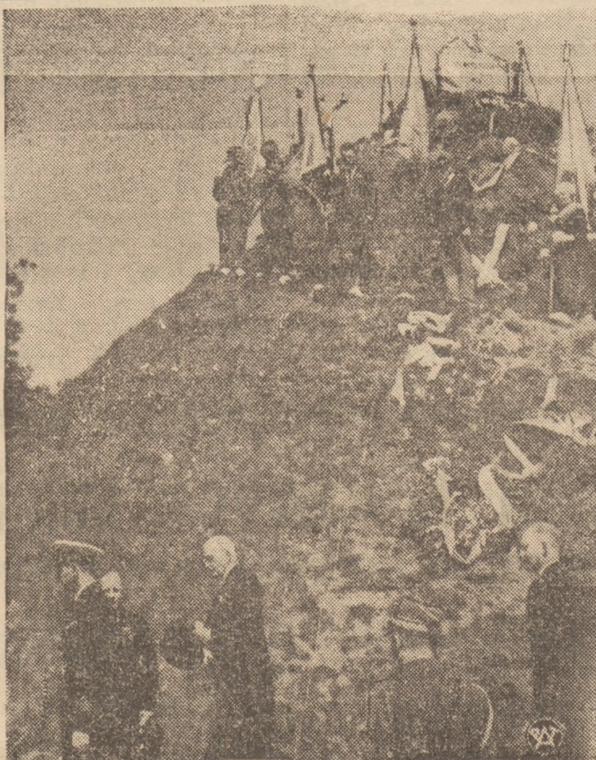
ODSLONIĘCIE PAMIĄTKOWEGO GLAZU I POŚWIĘCENIE KOPCA KU CZCI MARSZAŁKA JÓZEFA PIŁSUDSKIEGO WE WSI RZEWUSKIE ZAWADY.

Na zdjęciu — widzimy Pana Prezydenta Rzeczypospolitej w momencie przejścia obok nowousypanego kopca ku czci Marszałka Piłsudskiego w Zawadach.