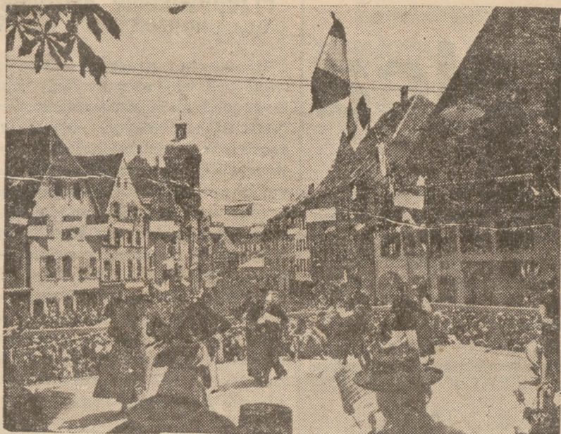
ALZACKIE ŚWIĘTO KOSTIUMOWE W WISSEMBOURGU.

Zdjęcie przedstawia fragment z trady- cyjnego święta kostiumowego w staro-