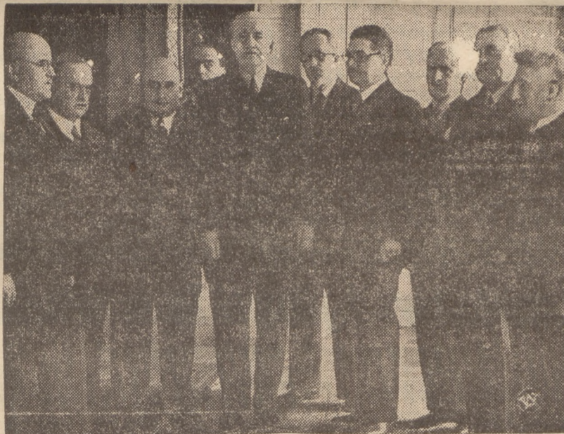
NACELNA REPREZENTACJA DZIEŃ NIKARSTWA POLSKIEGO U P. PREZYDENTA R. P.

Wyrok ogłoszony zostanie w końcu przyszłego tygodnia.