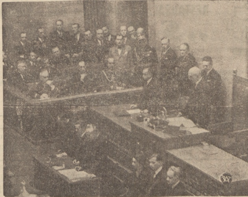
Na zdjęciu Marszałek Sławek na ciele wyboru. Na ławach rządowych — trybunie marszałkowskiej, po przyjęciu rząd z P. Premierem gen. Sławojem Składkowskim na czele.

Tak więc wyborem płk. Sławka — na marszałka Sejmu, uważa się sytuację polityczną za znacznie wyjaśnioną.