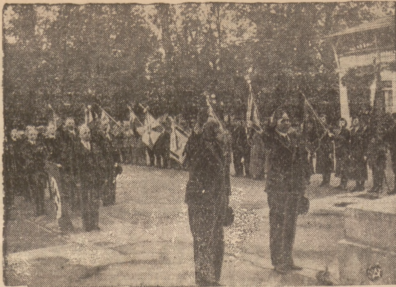
KOMBATANTY NIEMIECCY W WARSZAWIE.

Przedstawiciele powiatu będą przyjeżdżać przez p. premiera w Warszawie.