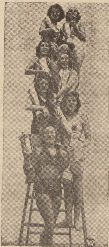
LAUREATKI KARNAWAŁU MORSKIEGO.

Sosnowiec, Orla róg Dzikiej Telefon 62521