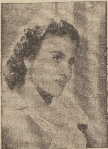
Olympe Bradna, bohaterka filmu „Rapsodia”. Realizuje obecnie film „Soubretka”

Ponieważ droga powrotna wypadała nam przez Myszów, przeto i tu odwiedziliśmy ośrodek półkolonii. Właśnie dzieci spożywały obiad, składający się z kromki chleba i pachnącego kapuśniaku. W ośrodku tym przebywa 40 dzieci.