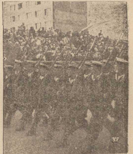
Dziarsko defilują polscy marynarze

ko ten przykład z przed 18-tu laty, świadczący, jakie skutki pociąga za sobą przenikanie w głąb społeczeństwa „idei żołnierstwa” i jak tragiczne ma następstwo jej brak w świadomości ogółu. Dziś wiemy już dobrze, że to, co się rozegrało na ziemiach polskich pod koniec 18-go stulecia — było następstwem zaniku „idei żołnierstwa”. Gdy sejmowi przeciwstawiały się „aukcji wojska”, gdy rozplenilo się w narodzie przeświadczenie, że „niechby wszędzie wojna, byle wieś spokojna”, gdy wokół państwa się zbroili, a Polska Sasów i Stanisława Augusta demobilizowała się, gdy zamarł duch żołnierski, który przenikał zastępy, wiedzione do zwycięstw przez Batorych i Chodkiewiczów i Koniecpolskich i Sobieskich — chyliła się Rzeczpospolita ku upadkowi i stała się łupem obcej przemoc.