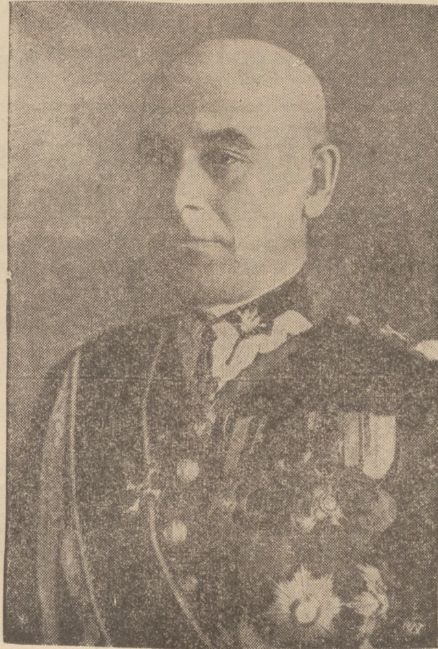
Naczelnny Wódz, Marszałek Śmigły Rydz.