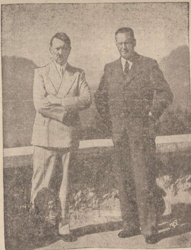
HITLER I HENLEIN.

Reprodukcję zdjęcie kanclerza Adolfa Hitlera z Konradem Henleinem