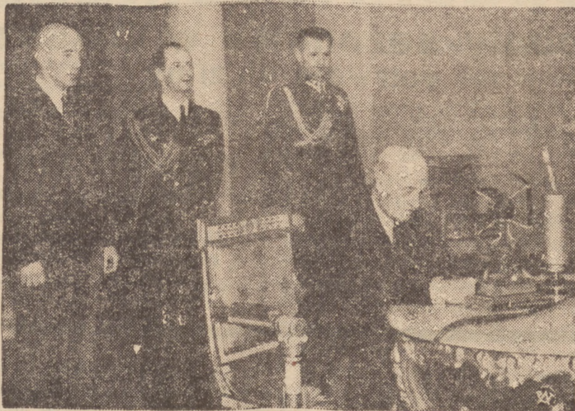
MOWA PANA PREZYDENTA RZECZYPOSPOLITEJ PRZEZ NADZIO DO AMERYKI.

Sądzimy bowiem, że stanowisko większości wyborców chroni Państwo Polskie nie tylko od wstrząsu, jaki wywarza słabość władzy, ale także od — dążności do wzrostu tej władzy. Innymi słowy: większość wyborców nie zezwoliła na to, by system rządzący Polską zawisnął w powietrzu, ale z drugiej strony ta większość wyborców, idąc do urny i spełniając swój obowiązek, wywróciła zwolennikom domorosłego totalizmu broń niebezpieczną i obosieczną, którą opozycjoniści partyjni wypychali po prostu naszym totalistom w ręce. Jest przecież rzecz jasna, że gdyby do urny poszło tylko trzydzieści czy czterdzieści procent wyborców, to wśród czynników reżimowych polniosłoby głowę żywioły, tłumaczące potrzebę „zaostrożenia kursu”. „dyktatorskich metod” itd. itd.”