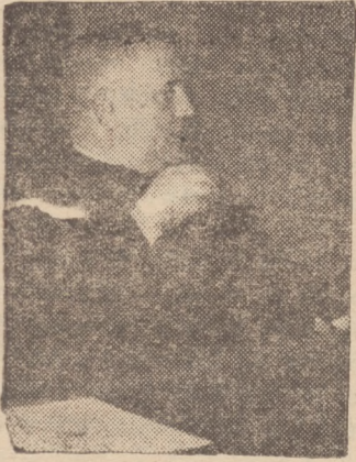
Premier, ks. Tiso.

„La libre Belgique”, organ katolików belgijskich, wychodzący w Brakseli, zamieszcza wywiad z premierem Słowacji, ks. Tiso, w którym znajdujemy szereg ciekawych punktów, wyjaśniających kulisy ostatnich wypadków na Słowacji.