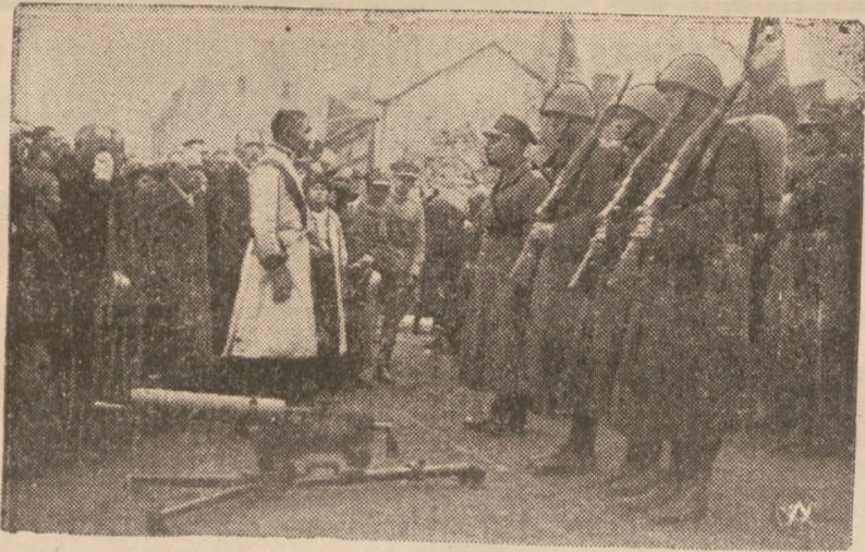
Uroczyste wręczenie w Brzesku przez wójta gminy Radłów miejscowemu pułkowi ciężkiego karabinu maszynowego ufundowanego przez ludność gminy.