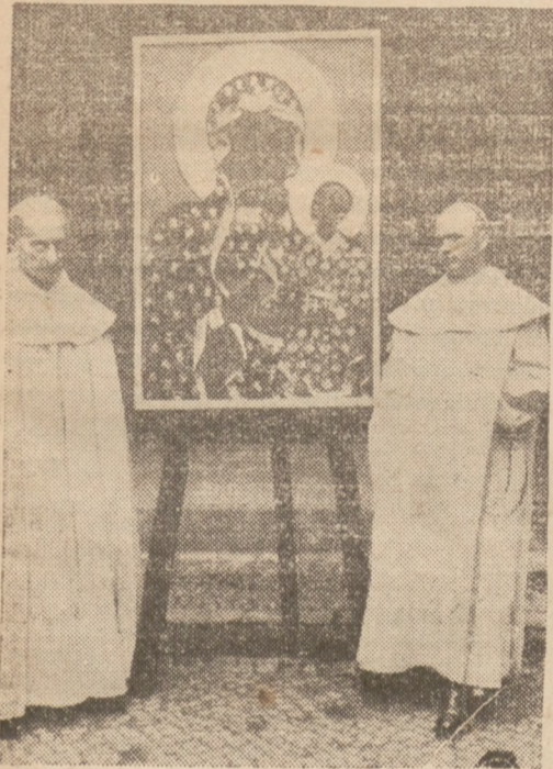
KOPIA CUDOWNEGO OBRAZU MATKI BOSKIEJ DLA KOŚCIOŁA W KARWINIE.

Z głębi ziemi wydobywający się grzmot góruje nad rytmem tętniących wzmoczoną pracą warsztatów fabryk. Huk, wstrząs — robi wrażenia echa dalekiego artyleryjskiego ognia. To najpotężniejszy w Polsce aktometryczny młot pięciotonowy w „Fabloku” (fabryka lokomotyw) ozwał się serią swoich ciosów. W ogłuszającym warkocie szlifierek i wiertarek, w potężnym, seryjnym łomocie kilkunastotonowych młotów gina rozkazy inżynierów, majstrów. Stal gnie się przy, syczy, pryska pod ciosami automatów. W hartowni wśród kłębiących się