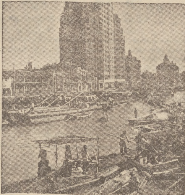
Na zdjęciu — rzut oka na port rybacki i handlowy Szanghaju. Obok małych dżonek rybackich, widzimy wspaniałe, nowoczesne drapacze chmur.