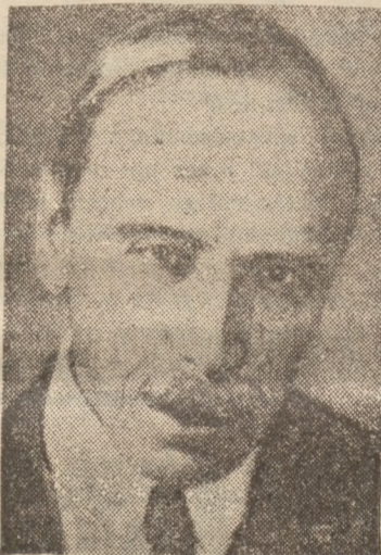
LAUREAT PAŃSTWOWEJ NAGRODY LITERACKIEJ.

Piątek, 30 grudnia. 6.30 Koleda 6.35 Gimnastyka 6.50 Muzyka 7.00 Dziennik poranny 7.15 Płyty 8.00 Przerwa 11.57 Sygnał czasu i hejnał z Kra Przerwa 15.00 Nasz koncert 15.30 Muzyka kowa 12.03 Audycja południowa 13.00 Przerwa 15.00 Zagadka historyczna dla młodzieży 15.30 Poradnik sportowy 15.30 Muzyka obiadowa 16.00 Dziennik południowy 16.05 Wiadomości gospodarcze 16.20 Rozmowa z chórem 16.35 Pieśni Michała Kucharskiego 16.55 Zima — pogad. 17.10 Kwartet fortepianowy 17.45 Dialog 18.30 Legenda 19.10 Lekka audycja muzyczna 20.35 Audycja informacyjna 21.00 Powieść mówiona 21.15 Koncert symfoniczny 22.00 Odezyt 22.45 Muzyka 22.55 Przegląd prasy 23.00 Ostatnie wiadomości dziennika wieczornego. Komunikat meteorologiczny 23.05 Wiadomości z Polski w języku francuskim 23.15 Patrz program W-wy II.