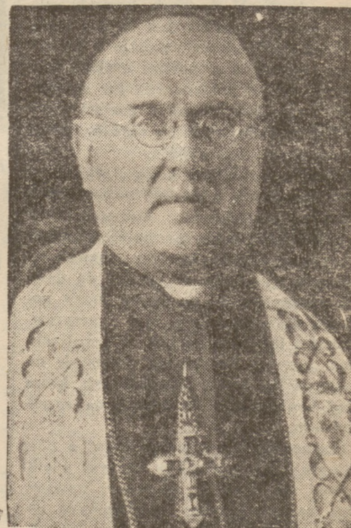
CIEŻKA CHOROBA J. EM. KS. KARDYNAŁA KAKOWSKIEGO

Reprodukcję podobizny J. Em. Księdza kardynała Aleksandra Kakowskiego, arcybiskupa metropolity warszawskiego, który ciężko zaniemógł.