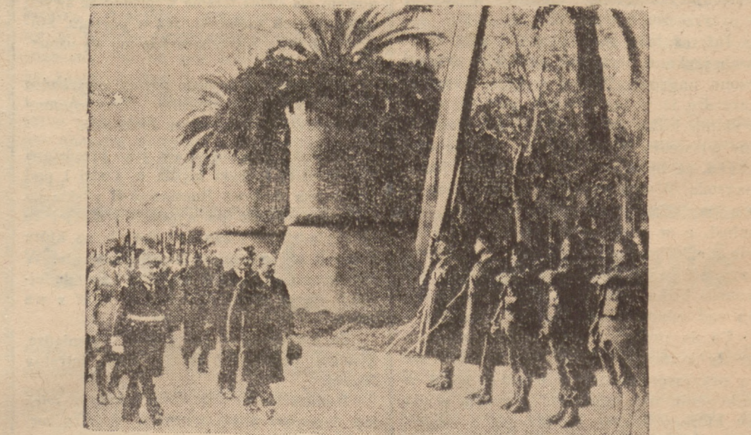
Zdjęcie przedstawia premiera Daladiera w towarzystwie ministra Campluchi po przybyciu do Ajaccio, przed frontem oddziału honorowego Senegalczyków.

administracji angielskiej Palestyna może doprowadzić do pozytywnych rezultatów. Zresztą w interesie samej Anglii leży, aby w Palestynie, ważnym dla niej punkcie wybrzeża Śródziemnomorskiego, mieć jakiś element, z którym będzie mogła współpracować i w miarę możliwości na nim się oprzeć. A elementem tym w żadnym wypadku nie jest i nie może być świat arabski, zmierzający, co prawda wolno, nie mniej jednak konsekwentnie ku wolności i niezależności. Radz.