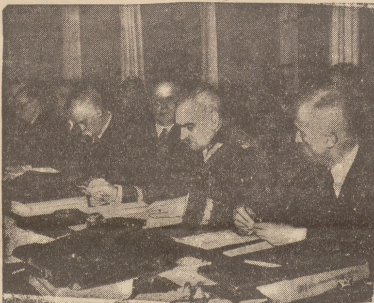
SENACKA KOMISJA BUDŻETOWA