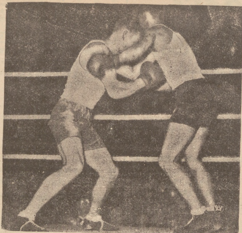
10 ZWYCIĘSKIM MECZU BOKSERSKIM POLSKA — SZWECJA.

Jak już donosiliśmy, reprezentacja bokserów Polski rozegrała w Sztokholmie zwycięski mecz z bokserską drużyną Szwecji, bijąc ją w stosunku 12:4.