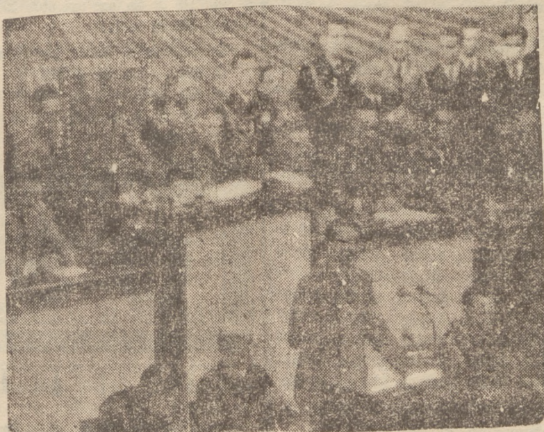
Moment przemówienia kanclerza Hitlera. Na fotelu przewodniczącego Reichstagu — feldmarszałek Goering

Tegoroczna mowa kanclerza Rzeszy kładzie nacisk przede wszystkim na sprawy gospodarcze i sprawy wewnętrzne Niemiec. Sprawy natury zewnętrzno-politycznej są w związku z tym potraktowane bardziej ogólnie i mniej ostro. Zapewnienia kanclerza, że Niemcy mają iść po drodze pokoju i że spodziewa się długiego okresu pokoju w Europie, że pragnie podjąć kampanię o wyprowadzeniu Niemiec z trudności gospodarczych przez przyznanie im odpowiedniego udziału w podziale bogactw kolonialnych, podziały też naogół uspokajające na opinię europejską w szczególności na opinię europejską. Aczkolwiek nie ukrywa ona pewnych obaw, przecież jak widać z dotychczasowych informacji przyjęła ona mowę Hitlera jako zapowiedź, że stosunki międzynarodowe rozwijają się będą w najbliższej przyszłości na terenie rokowań skupiających się około za-